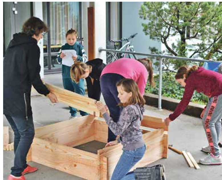
Bau der Hochbeete.

Die Schülerinnen und Schüler hoffen, den Bienen mit diesem Projekt eine Freude bereitet zu haben und freuen sich schon jetzt auf feinen, aromatischen Tee und würzige Kräutermischungen.