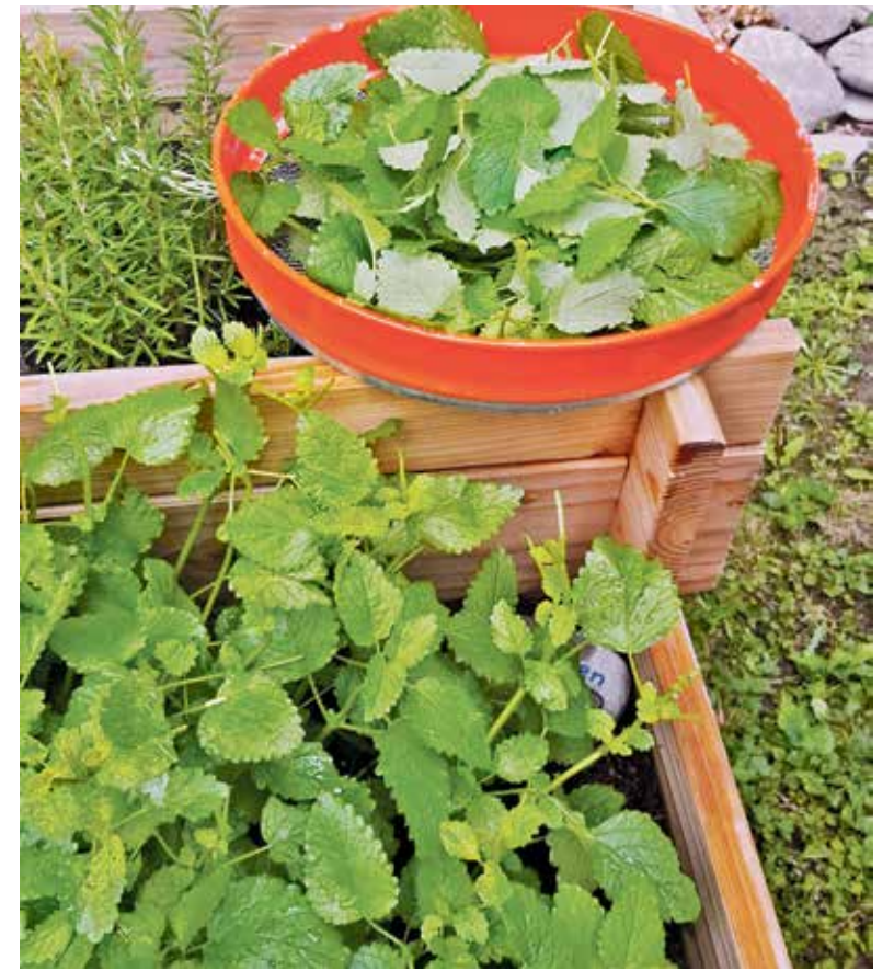
Die Ernte steht an.