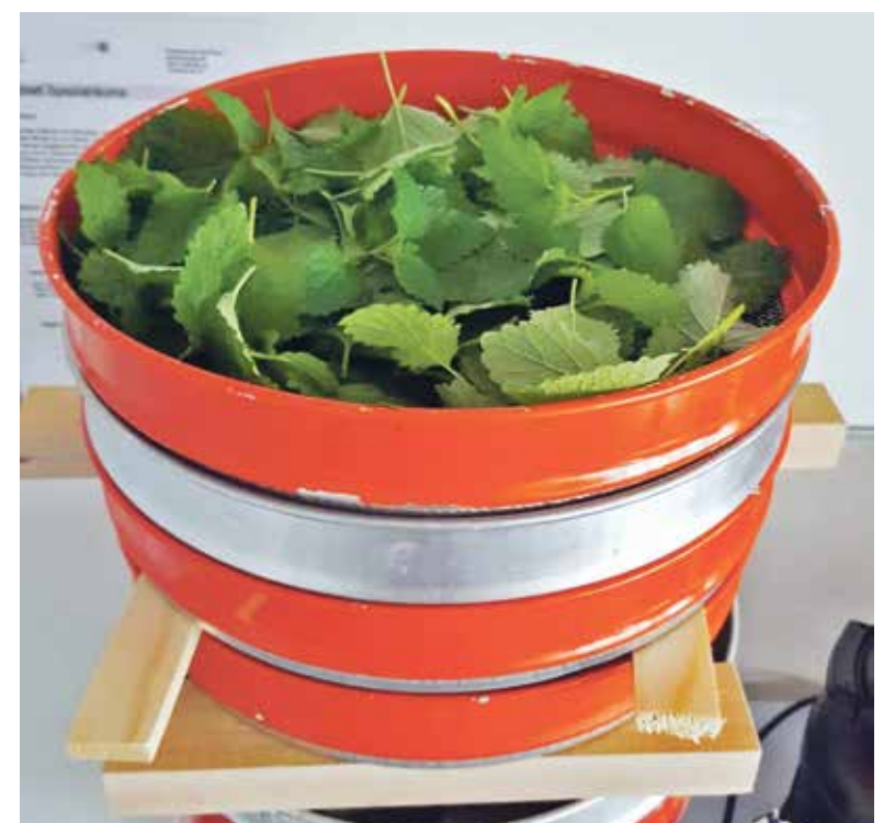
Trocknen der Melissenblätter.