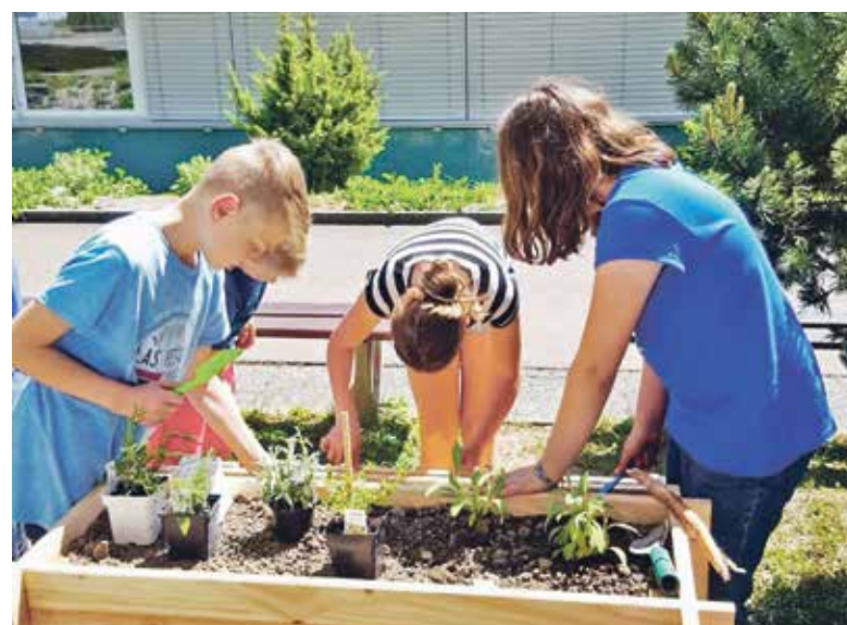
Eifrig wird bepflanzt.