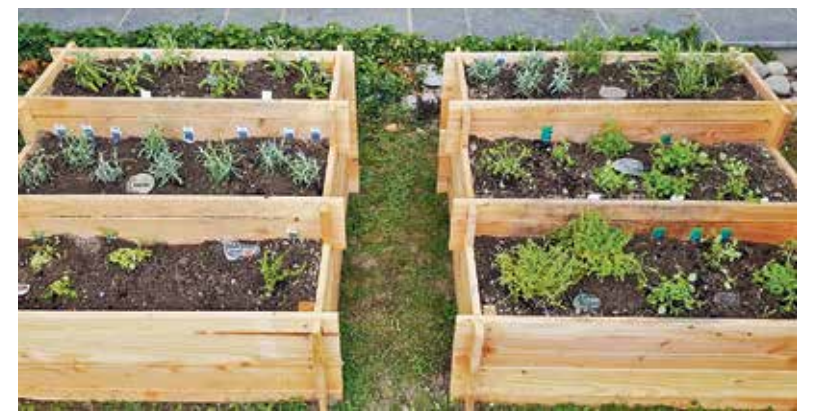
Nun darf es wachsen.