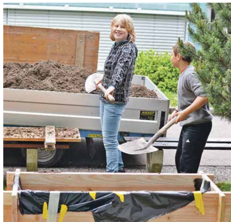
Die Beete werden mit Erde gefüllt.