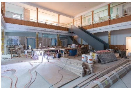
Empfang MediZentrum (ehemaliger Saal)

Nun steht das altherwürdige Landhaus in neuer Frische da. Der Umbau war eine grosse Herausforderung. Im Zentrum stand der Erhalt des historischen Charakters des Gebäudes. Diesem Anspruch gerecht zu werden, erforderte einen intensiven Planungsprozess. Schlussendlich ist es aber gelungen, ein Projekt auszuarbeiten, welches dem historischen Gebäude und den Anforderungen der neuen Nutzung Rechnung trägt. Nach der Planung hatte auch die gesamte Realisierung seine Tücken. Mauern und Fundamenteile aus bröckelnden Bruchsteinen, schiefe Backsteine, alte Zeitzeugen, etc. waren nicht vorhersehbar und führten zu leichten Verzögerungen. Nun sind die Renovation und der Neubau aber bald abgeschlossen. Noch stehen letzte Innenausbauarbeiten an, bevor der Betrieb im Landhaus aufgenommen werden kann.