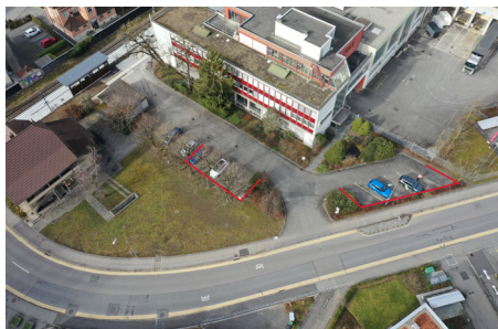
Lage der 11 Ersatzparkplätze bei Cremo