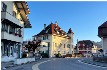
Zufahrt bis Maienstrasse bleibt möglich