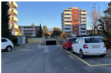
Kurzzeitige Sperrung Einstellhallenzufahrt