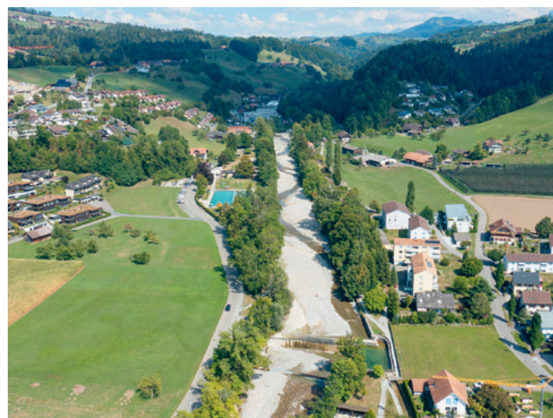
Bild mit Blick von der Müllerschwelle Richtung Gummsteg.