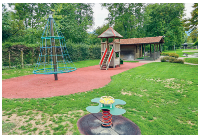
Spielplatz Badi Steffisburg.