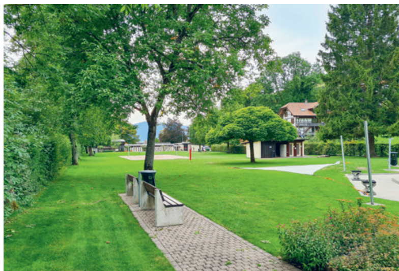
Hintere Rasenfläche Badi Steffisburg.

Nachdem am 16. September eine weitere schöne Badesaison zu Ende gegangen ist, kann die Bevölkerung den hinteren Bereich der Badi Steffisburg (ab dem Garderobentrakt/Restaurant ostwärts) seit Sonntag, 1. Oktober, wieder nutzen. Er ist bis und mit Montag, 1. April 2024 (Ostermontag) öffentlich zugänglich. Das Gelände ist im vorgenannten Zeitraum täglich geöffnet, der Zugang erfolgt über das Tor beim hinteren Parkplatz. Zwischen dem 1. April 2024 und dem Badesaisonstart 2024 bleibt das Areal für Reinigungs-, Unterhalts- und Saisonvorbereitungsarbeiten geschlossen. Auch in den kommenden Jahren soll das grosse und attraktive Areal durch die Bevölkerung nahezu ganzjährig für die aktive Freizeitgestaltung genutzt werden können. Der hintere Bereich mit Rasenfläche und Spielplatz wird künftig jährlich von Anfang Oktober bis Anfang April geöffnet sein.