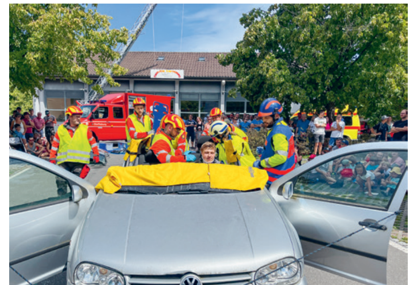
Am Tag der offenen Tore der Feuerwehr Steffisburg regio gab es einiges zu sehen.

Am Samstag, 19. August, führte die Feuerwehr Steffisburg regio zusammen mit der regionalen Zivilschutzorganisation Steffisburg Zug, der Kantonspolizei und dem Rettungsdienst STS einen Tag der offenen Tore durch. Das Ziel der Feuerwehr war es, die Tore für Interessierte zu öffnen und der Bevölkerung zu zeigen, wie die Blaulichtorganisationen funktionieren und was die Feuerwehr alles leistet. Auch für die Kinder stand ein vielseitiges Angebot an Unterhaltung und Aktivitäten zur Verfügung und rund um den Verpflegungsstand roch es den ganzen Tag nach Bratwürsten und Raclettekäse. Die Bevölkerung zeigte sich durch ihr zahlreiches Erscheinen an den Blaulichtorganisationen interessiert. Dass dieser Anlass so rege besucht wurde, ist für die beteiligten Organisationen ein ganz grosses Zeichen an Wertschätzung und Vertrauen. Die Angehörigen der Feuerwehr Steffisburg regio bedanken sich bei der Bevölkerung ganz herzlich für das grosse Interesse und die vielen angeregten Gespräche. Die Verantwortlichen hoffen, dass die Besucher und Besucherinnen einen interessanten Tag erleben durften, die Organisationen besser kennenzulernen und brennende Fragen beantwortet erhielten. Das Kommando bedankt sich beim Organisationskomitee und allen Helferinnen und Helfer ganz herzlich. Dank der grossen Unterstützung aus den Reihen der Feuerwehr konnte dieser Tag durchgeführt werden.