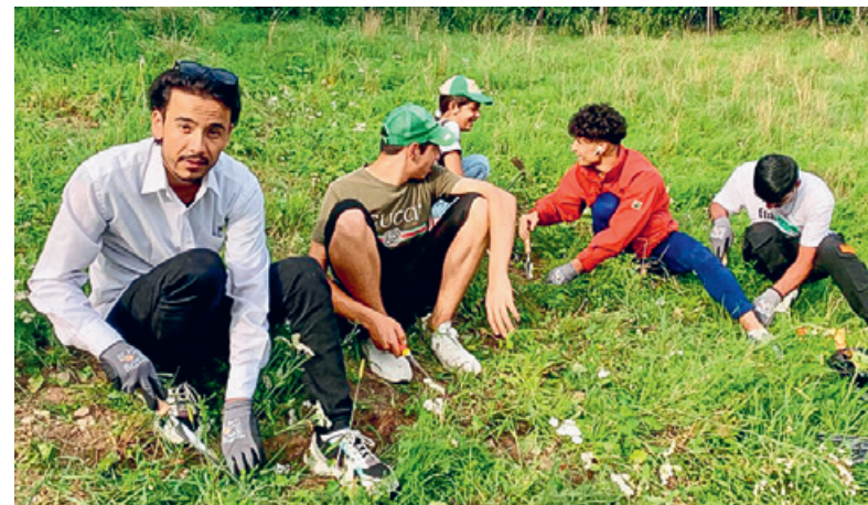
Freiwillige bekämpfen in Steffisburg invasive Neophyten.

Das Arbeiten miteinander verbindet. Wenn wir uns später im Dorf treffen, können wir auf ein gemeinsames Erlebnis zurückblicken und uns freudig grüssen.»