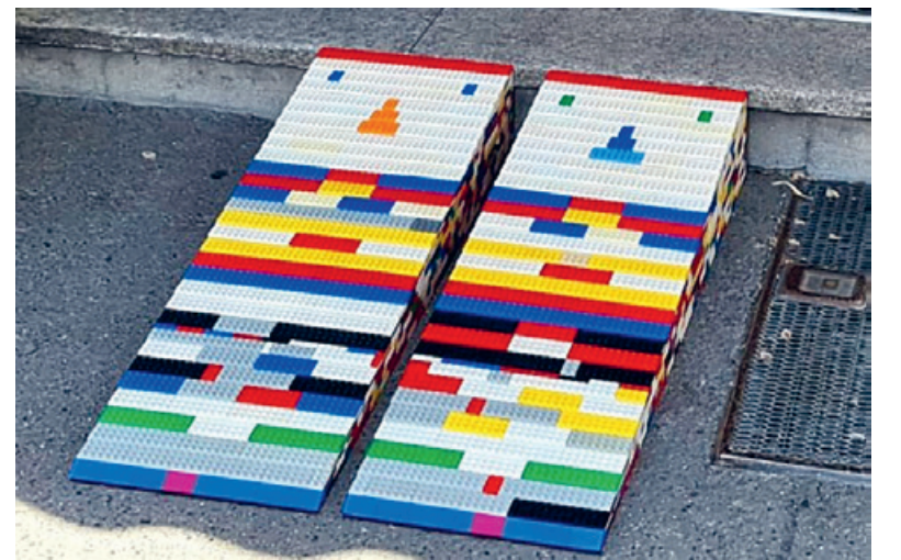
Mit Lego-Rampen lassen sich Stufen überwinden.