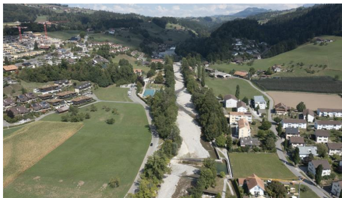
Bild mit Blick von der Müllerschwelle Richtung Gummsteg