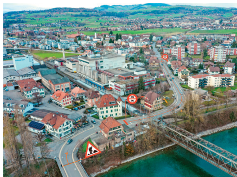
Die Schwäbisstrasse Süd aus der Vogelperspektive.

Ebenfalls seit 4. März führt die Fernwärme Thun AG in der General-Wille-Strasse Arbeiten an der Fernwärmeleitung aus. Die General-Wille-Strasse ist deshalb nur einspurig in Richtung Burgerstrasse befahrbar. Diese Arbeiten stehen nicht im Zusammenhang mit dem Werkleitungsbau in der Schwäbisstrasse Süd.