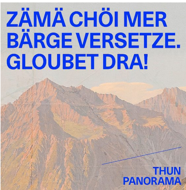
Wer das grösste Rundpanorama Europas trotz geschlossener Türen sehen will, kann dies auf der Website des Kunstmuseums tun.

Elsa Horstkötter im Kunstmuseum zuständig für Marketing und Kommunikation