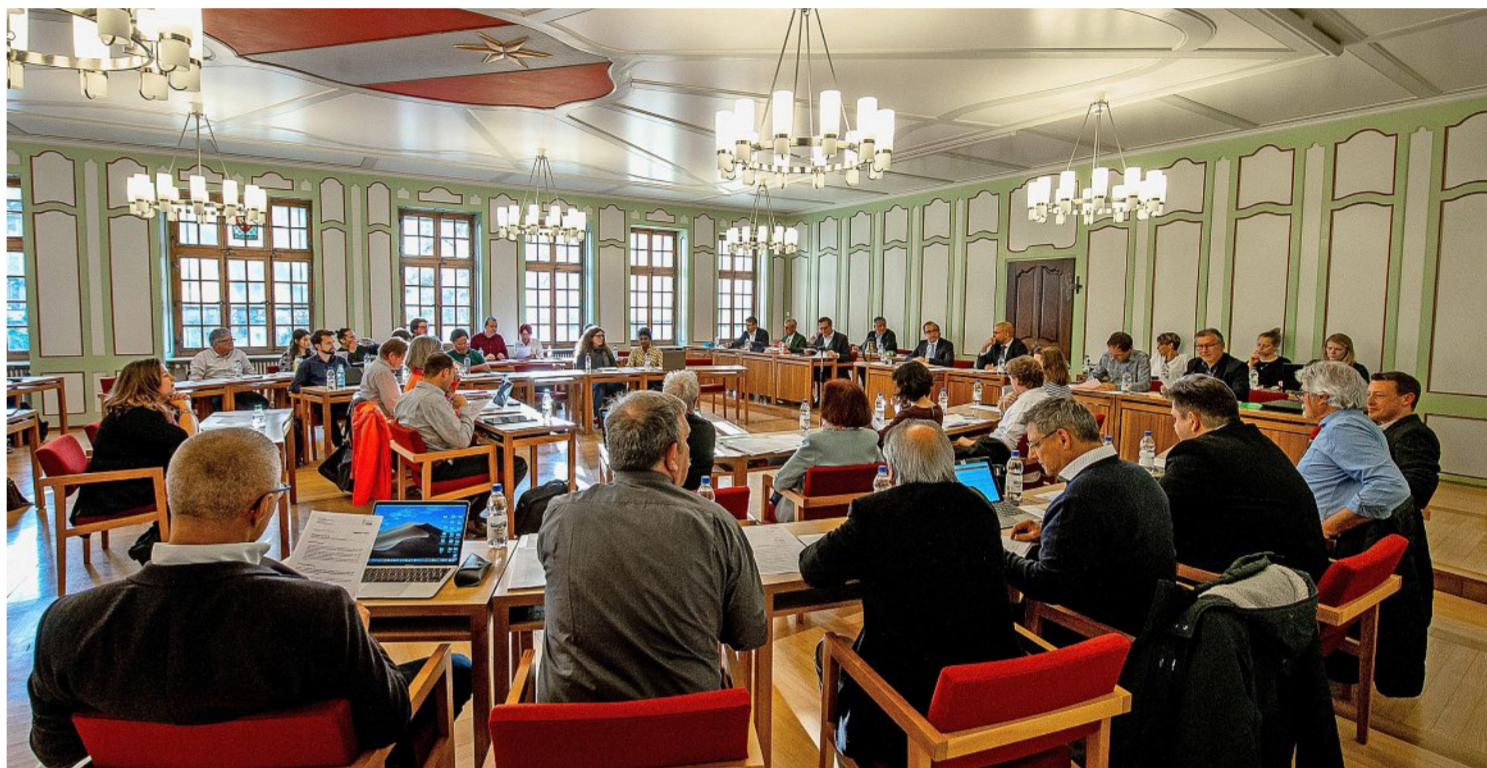
Der Thuner Stadtrat während einer Sitzung im Rathaus. Am 7. Mai wird das Parlament im KKThun tagen.

Politik in Thun Die Parlamentssitzungen von Mai, Juni und Juli finden statt – allerdings nicht im Rathaus, sondern im KKThun. Welche weiteren Massnahmen sind notwendig?